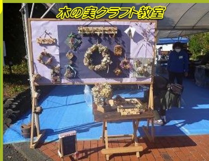
木の奥クラブ教室