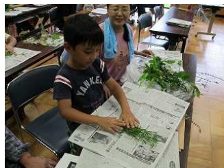
<植物の標本づくり>