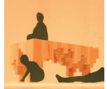
0082 アンダーイ-under dai-