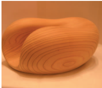
0052 すべすべすべり台