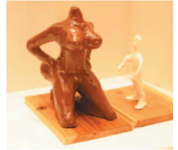
0041 セクシーステップ