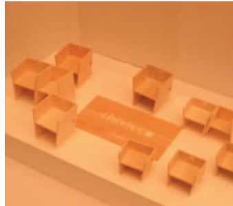
0055 chivikko chair